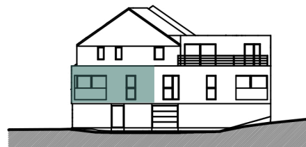
FACADE RUE DU VILLAGE